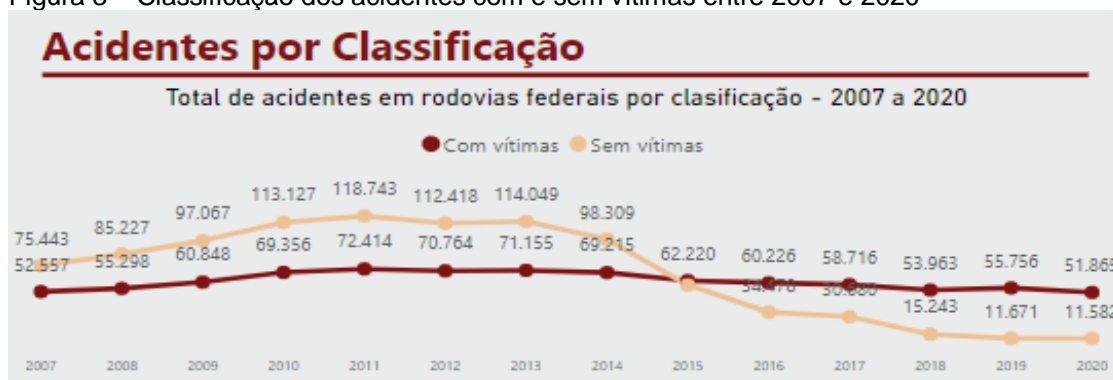
Figura 3 – Classificação dos acidentes com e sem vítimas entre 2007 e 2020

A Figura 3 apresenta dados da classificação dos acidentes entre os anos de 2007 a 2020, apresentando um gráfico onde demonstra quando houve vitimas ou não nos determinados anos, assim como a quantidade especifica.